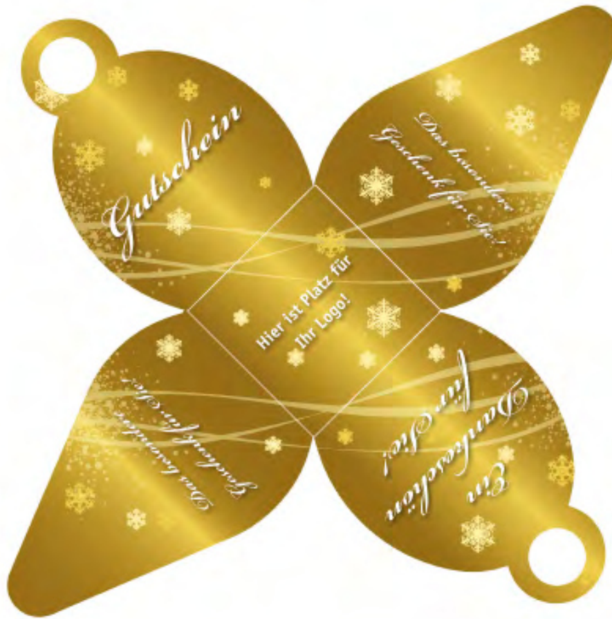
Die GOLDENE GeMax-Wichtelbox - verkleinerte Darstellung