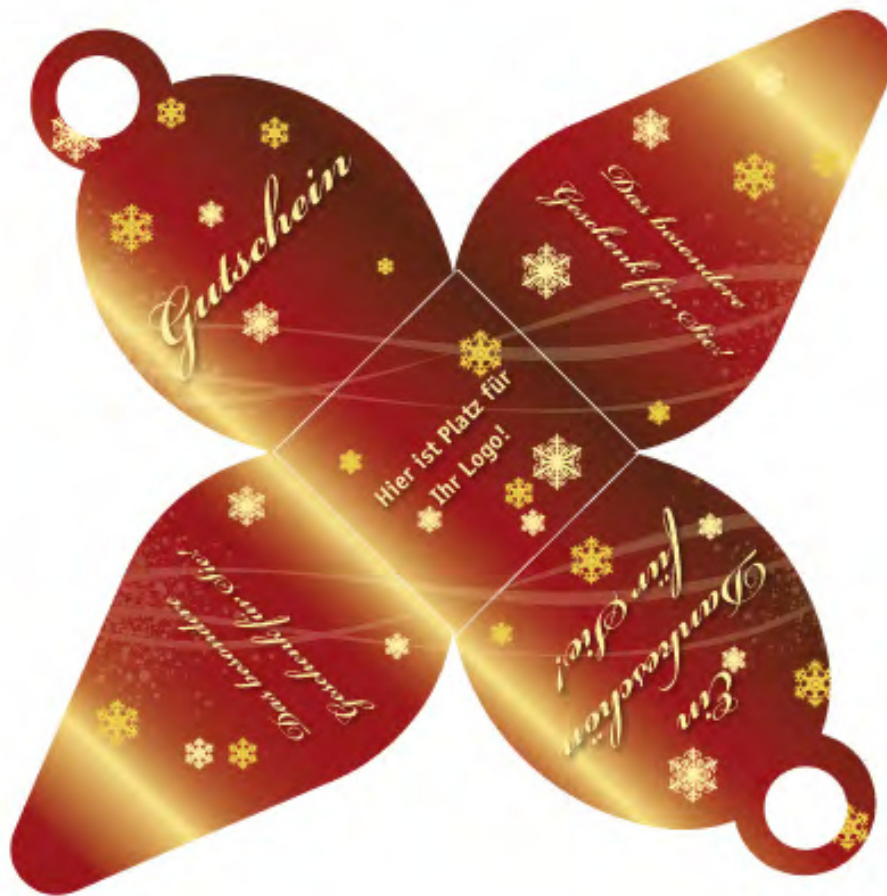
Die ROTE GeMax-Wichtelbox - verkleinerte Darstellung